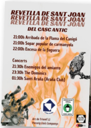
Revetlla de Sant Joan.