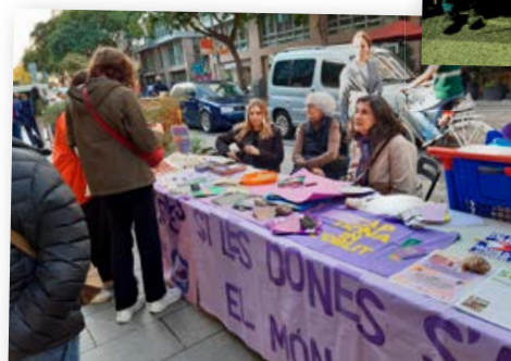
Taula de dones davant del Mercat.