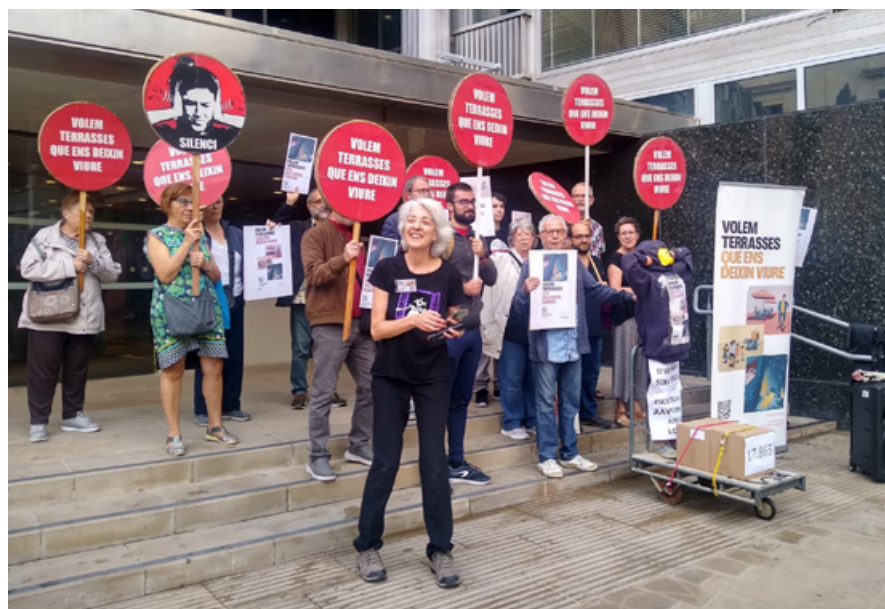
Entrega de signatures a l'Ajuntament, el 15 d'octubre.

Ara toca estar alerta i confiar que la feina feta arribi a bon port. ♦