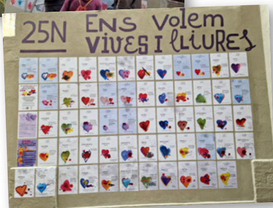
Cartells de denúncia del carrer Bòria.