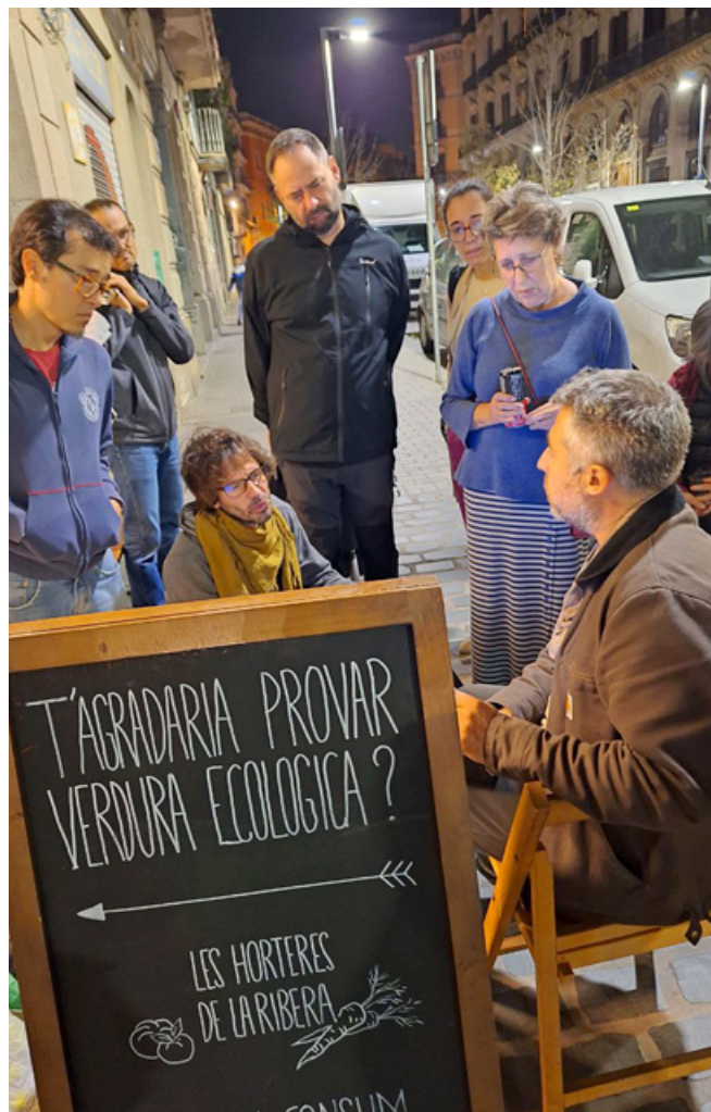
Els companys de la cooperativa ens reunim els dijous al vespre per repartir les cistelles i comentar les novetats.

Per a emplatar, servirem la crema en un bol mitjà o un plat fondo. Afegirem unes quantes avellanes torrades picades i una mica de coriandre fresc, també picat (fulla i tija). Rematarem amb un fil d'oli d'oliva i un raig de llimona. Bon profit! ♦