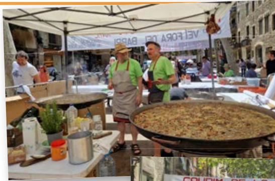
Preparació de la paella popular, al Passeig del Born.