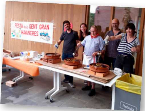
Festa de la Gent Gran i Havaneres.