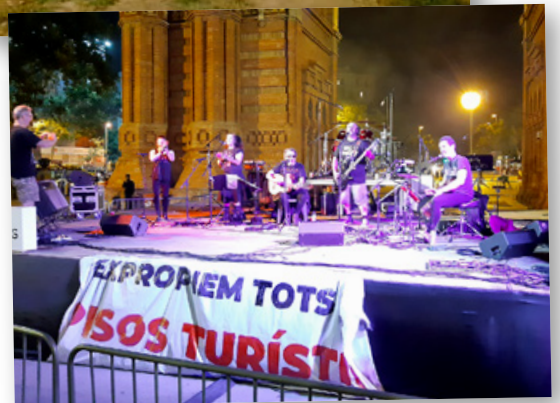
Concert Sant Joan.

L'EIX COMERCIAL MÉS ANTIC DE LA CIUTAT !