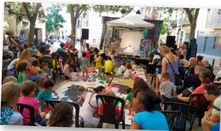
Jocs infantils i contacontes.