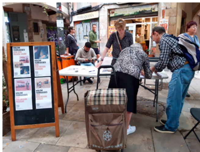
Recollida de signatures als barris.

els articles de l'Ordenança de Terrasses actual per modificar-los i aconseguir una legislació més clara i justa.