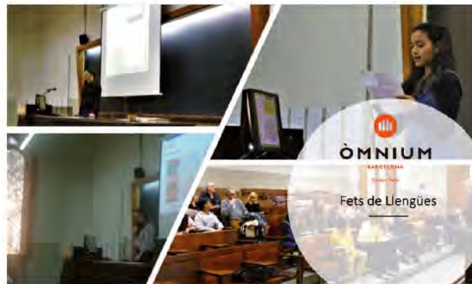
Aspectes de l'acte final de Fets de Llengües, 2020, Universitat de Barcelona.

Per acabar volem fer una crida als qui vulgueu participar en algun d'aquests projectes. Com a docents en centres dels nostres