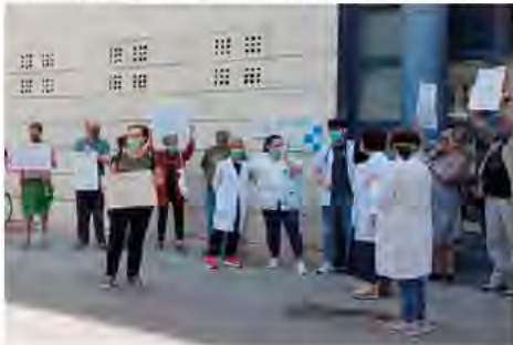
Protestes davant del CAP, el 10 de juny i el 25 de juny, respectivament.