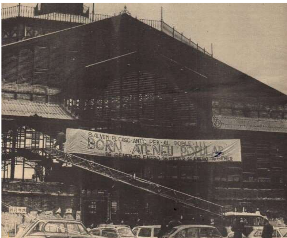
Fotografia mercat del Born 1977