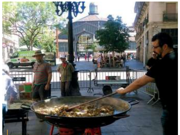
Paella popular, 1 de juliol