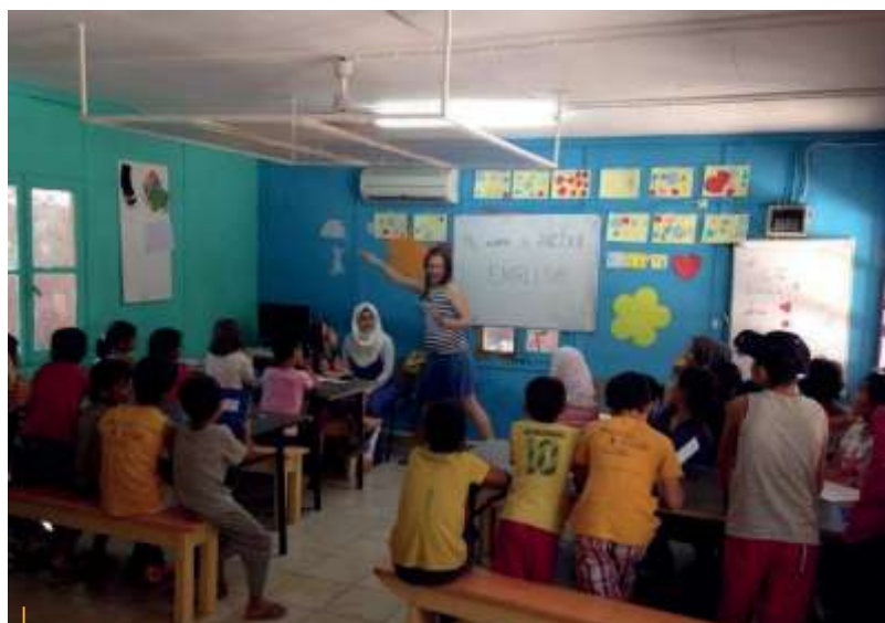
Aula de formació