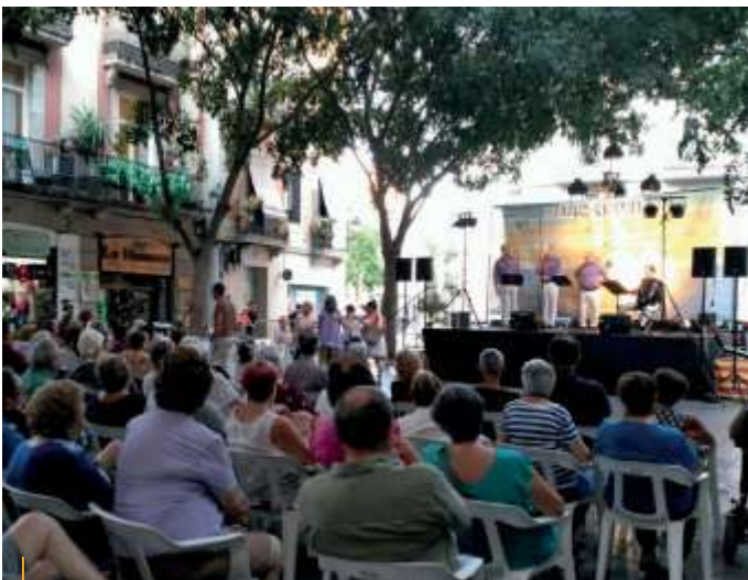
Festa de la Gent Gran, 28 de Juny

La festa es va acabar amb el goig per l'ocupació popular del carrer, per l'intercanvi d'experiències entre les diferents entitats i els veïns i amb la determinació que l'any vinent hi puguem tornar a ser.