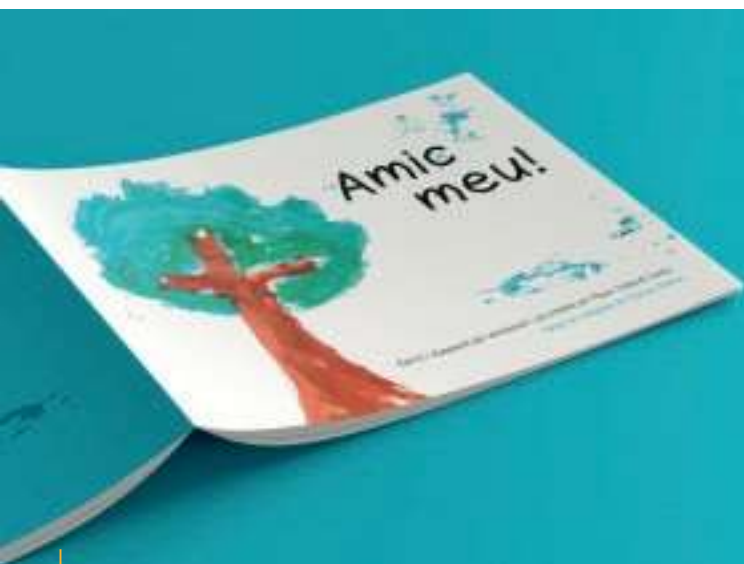
Edició llibre Amic Meu