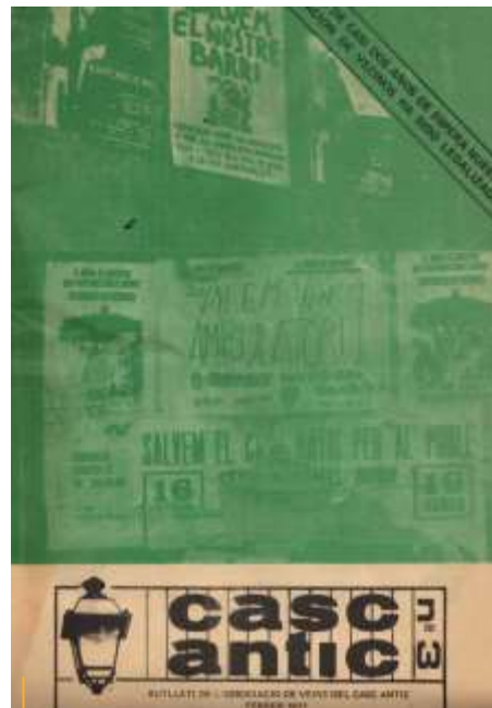
Butlletí febrer 1977