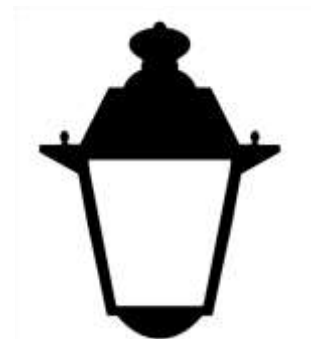
Associació de Veïns i Veïnes per la rehabilitació del Casc Antic

Un dels objectius fonamentals del centre, però, és la prevenció de situacions de risc, la detecció de problemes emergents, el suport a persones en risc de deteriorament de salut i la detecció de noves formes de consum i noves substàncies