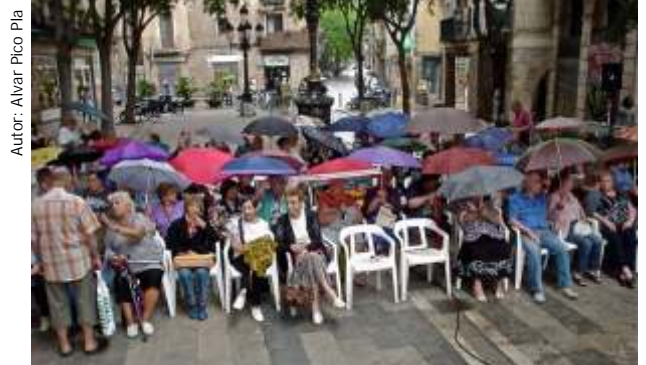
Autor: Alvar Pico Pla