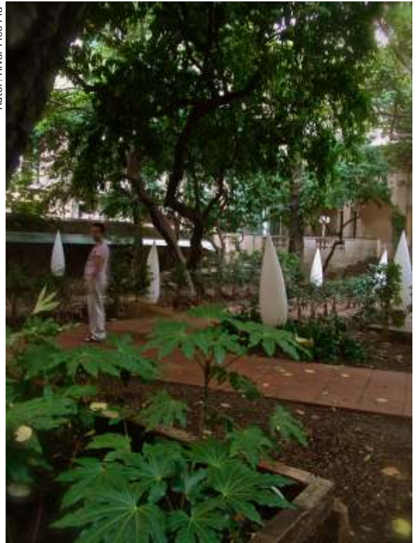
Autor: Alvar Pico Pla

La discussió no va trigar a encendre's davant l'ofertament per part del cambrer a abandonar la taula i les cadires aduint que eren de l'hotel i per tant privades. De sobte els veïns es veien asseguts a terra en el poc espai que deixaven al jardí públic l'ocupació del mobiliari privat.