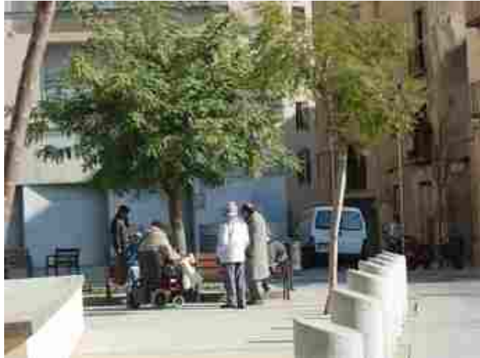
Autor: Mercè Queralt de Quadras