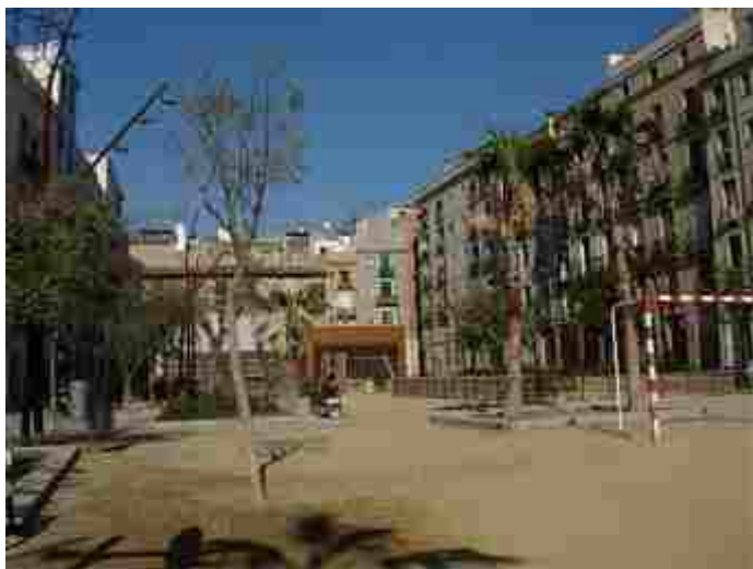
Autor: Mercè Queralt de Quadras