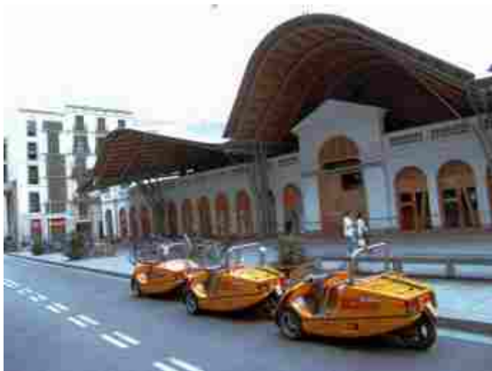
Autor: Alvar Pico Pla

L'ajuntament de Barcelona promou un procés participatiu per a determinar els principals objectius i propostes del pla estratègic de turisme amb perspectiva 2015. Com xarxa veïnal una vegada més participem manifestant el costat fosc del model turístic que impera a Ciutat Vella. Creiem que les nostres reflexions han de ser ja incorporades com mesures concretes. L'actual revisió del pla d'usos és la possibilitat d'incorporar nous criteris que re configuren les relacions entre habitants, ciutat i turisme. Els poders públics i sectors privats demanen la col.laboració de la població local. Nosaltres demanem no ser consultats com a quota mínima necessària per poder justificar pseudodemocràticament una acció, sinó participar en igualtat d'oportunitats.