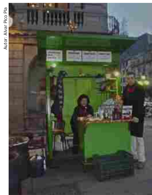
Autor: Alvar Pico Pla