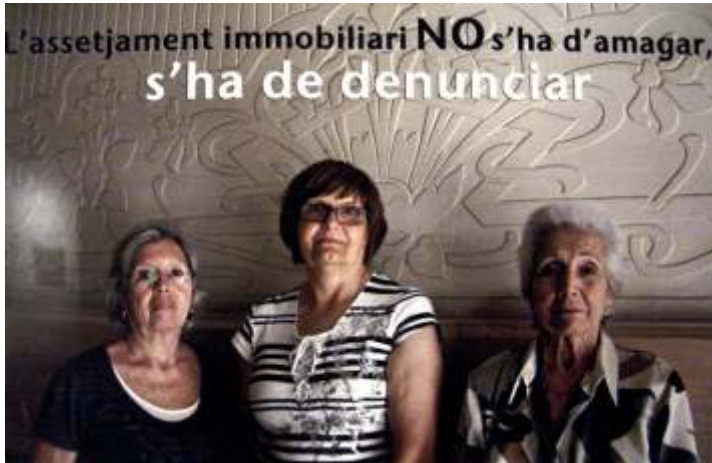
Exposició Claus de Dones, Fotografies d'Anna Turbau

L'assetjament immobiliari es pot practicar en "NOM DE LA LLEI", ja que hi ha unes lleis (moltes encara) que afavoreixen un determinat grup minoritari de població, aquells que tenen els recursos a les seves mans i les administracions ho justifiquen amb l'argumentació que és un tema entre privats (està clar que quan alguna persona en mata un altre, també és entre privats... o no?)