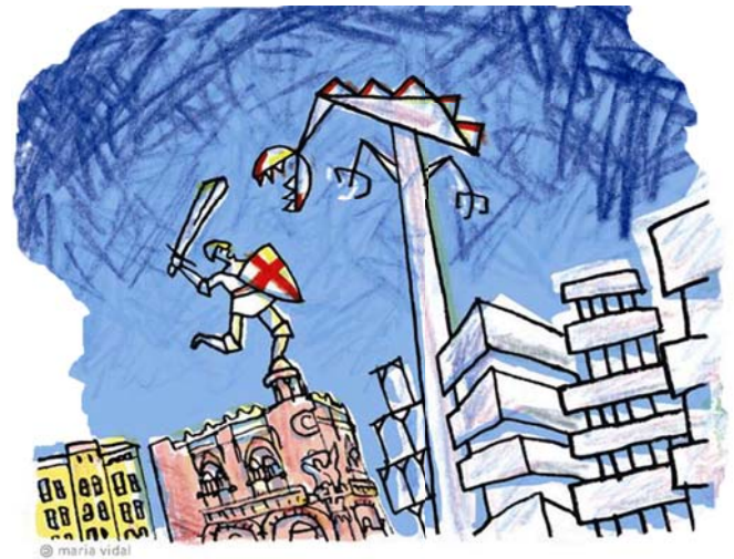
Autor: Maria Vidal

També ens pregunten: Com s'entén que les administracions, Estat, Generalitat de Catalunya i Ajuntament de Barcelona pactin amb el Sr. Millet imputat, temps enrere, en altres afers considerats delictius? Com és que l'Ajuntament modifica el Pla General Metropolità per fer l'hotel beneficiant al Patronat del Palau quan la propietat dels edificis son ja de la cadena Olivia-Hotels?