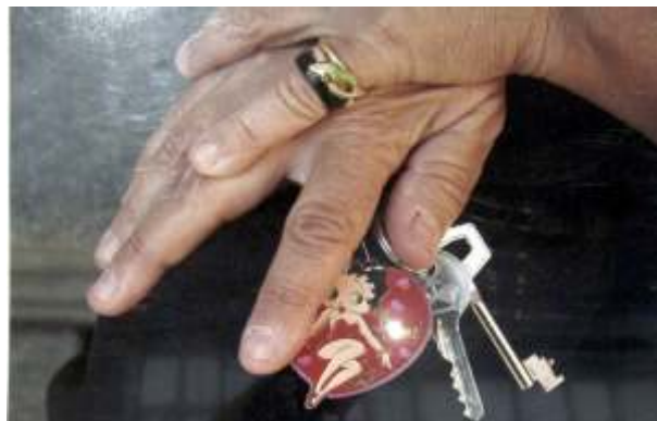
Exposició Claus de Dones, Fotografies d'Anna Turbau

Tenim molts testimonis de dones que han patit aquest tipus característic de violència. Algunes s'han vist marginades i han quedat profundament malmeses... D'altres han pogut afrontar amb èxit aquesta dolorosa vivència i sortir-ne enfortides.