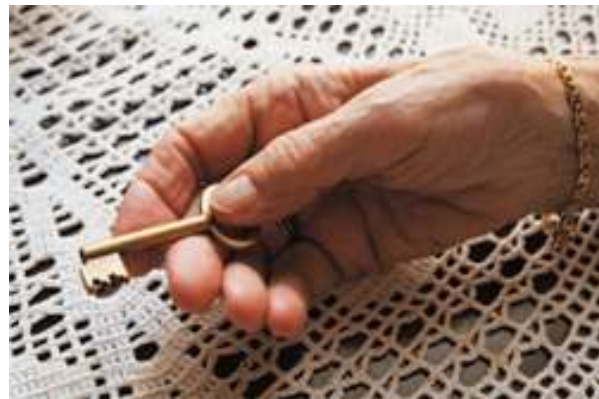
Exposició Claus de Dones, Fotografies d'Anna Turbau

Dones joves obligades a compartir habitatge... quan potser s'estimarien més viure soles; dones grans amb pocs recursos... L'habitatge és alhora lloc de treball i espai simbòlic, per la no repartició social del treball domèstic i per la càrrega emocional que les dones hi associen.