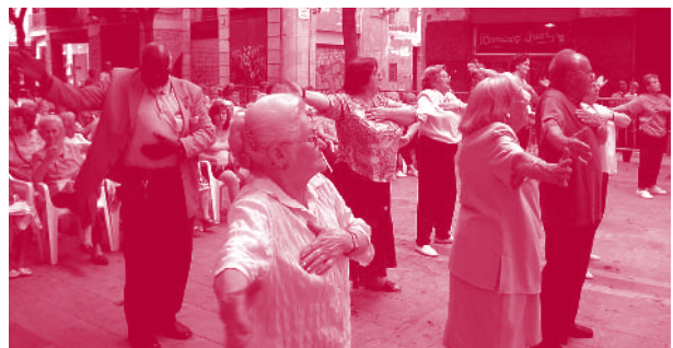
Exercicis al carrer