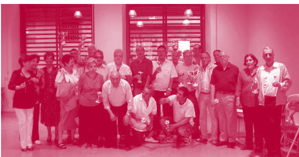
Entrega premis Campionat dominó