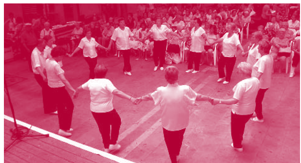
Concert de música tradicional